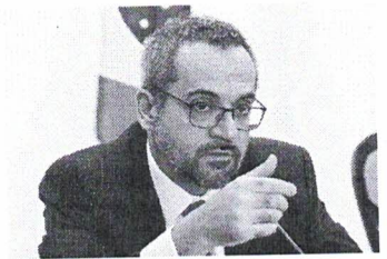
Weintraub recebeu ajuda do Itamaraty para entrar nos EUA

Em resposta a dois pedidos via Lei de Acesso à Informação, o Itamaraty respondeu que o próprio Weintraub comunicou o chanceler Ernesto Araujo que iria assumir o cargo de diretor-executivo no Banco Mundial. Por isso, o ex-ministro solicitou os "bons ofícios" do Itamaraty para requerer o visto. O pedido de Weintraub a Ernesto Araujo se deu no dia 18 de junho, exatamente a data em que o então ministro e o presidente Jair Bolsonaro (sem partido) publicaram um vídeo no qual anunciaram a saída do então titular do MEC. Weintraub disse a Araujo